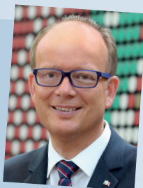
André Kuper, Präsident des Landtags Nordrhein-Westfalen

Geboren 1960 in Wiedenbrück, Studium der Verwaltungswissenschaften und Studium der Wirtschaftswissenschaften sowie