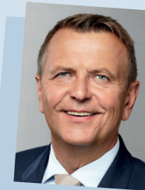
Christof Rasche, 3. Vizepräsident des Landtags

verschiedenen Menschenrechts- und Migrantenorganisationen. Seit 2017 Mitglied des Landtags, am 1. Juni 2022 Wahl zur 2. Vizepräsidentin des Landtags.