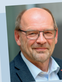
Rainer Schmeltzer, 1. Vizepräsident des Landtags

Erwerb des Fachlehrerdiploms Pädagogik. Dozent am Studieninstitut für kommunale Verwaltung und bis 2012 Hauptamtlicher Bürgermeister der Stadt Rietberg, verheiratet, zwei Kinder. Seit 2017 Präsident des Landtags Nordrhein-Westfalen (erneute Wahl am 1. Juni 2022).