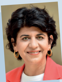
Berivan Aymaz, 2. Vizepräsidentin des Landtags

Geboren 1961 in Lünen, Wohnungsfachwirt und Gewerkschaftssekretär der Gewerkschaft ÖTV, verheiratet, ein Kind. 2015 bis 2017 Minister für Arbeit, Integration und Soziales des Landes Nordrhein-Westfalen, seit 2000 Abgeordneter des Landtags, am 1. Juni 2022 Wahl zum 1. Vizepräsidenten des Landtags.