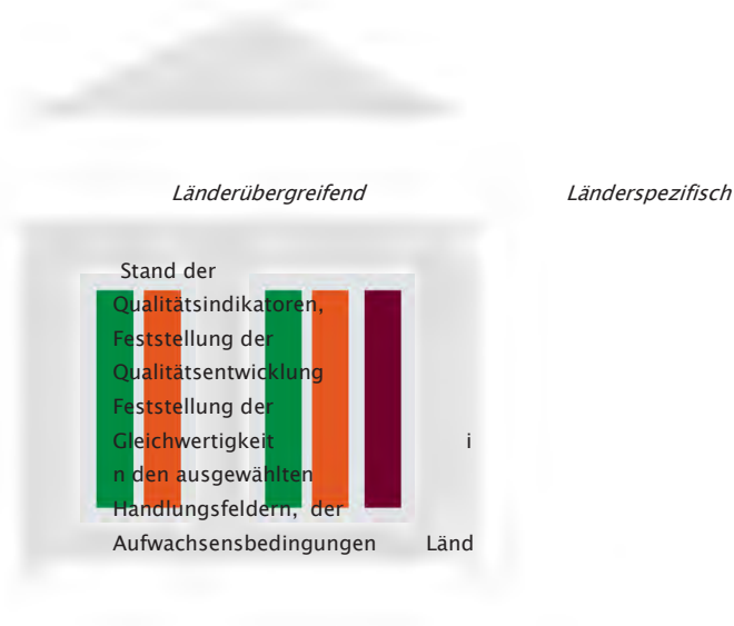
Abbildung 2: Bestandteile des Monitorings

Das datenbasierte Monitoring wird sich sowohl auf bereits etablierte Indikatoren als auch auf