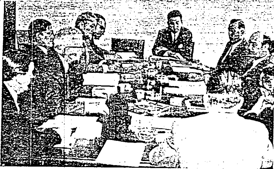
BSt-Landesvorstand bei Finanzminister Wertz

zwischen dem Minister und dem BSt. Der Minister versprach, sich auf jede Weise dafür einzusetzen, daß die Steuerbeamten auch im Rahmen zukünftiger Entwicklung gegenüber anderen Beamten- und Berufsgruppen nicht benachteiligt und ihre berechtigten Ansprüche auf gerechte Besoldung und Bewertung berücksichtigt würden. Der BSt trug dem Minister sodann konkrete Empfehlungen zur Verwaltungs- und Steuerreform vor, insbesondere zur Vereinfachung des Lohnsteuerverfahrens.