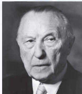
Konrad Adenauer (CDU)