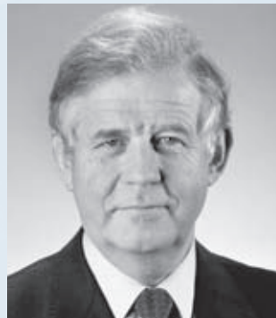
Kurt Biedenkopf (CDU)