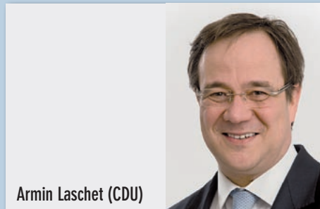
Armin Laschet (CDU)

„Landtag Intern“ macht den Aufschlag, die Abgeordneten retournieren.