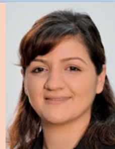
Özlem Alev Demirel (Linke)

... dramatisch verschlechtert. Hauptursache sind Beschlüsse im Land und im Bund von CDU, FDP, SPD und Grünen, die zu massiven Steuersenkungen für Unternehmen und Vermögende führten und drastische Einbrüche der Steuereinnahmen zur Folge hatten. Außerdem wurde vielfach das Konnexitätsprinzip – wer bestellt, zahlt – missachtet.