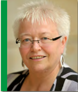
Sigrid Beer (GRÜNE)

... sollte klar und leserlich sein und dabei den Schreibenden leicht von der Hand gehen. Dabei geht es darum, dass der Bewegungsablauf flüssig ist, die Bewegung „in der Luft“ gehört dazu. Es geht eben nicht darum, dass die Buchstaben auf dem Papier verbunden sind. Eine krampfhaft geführte Hand schreibt weder schön noch gerne.