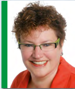
Ulrich Alda (FDP)