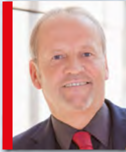
Rainer Bischoff (SPD)