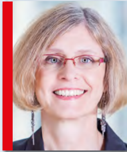
Regina Kopp-Herr (SPD)