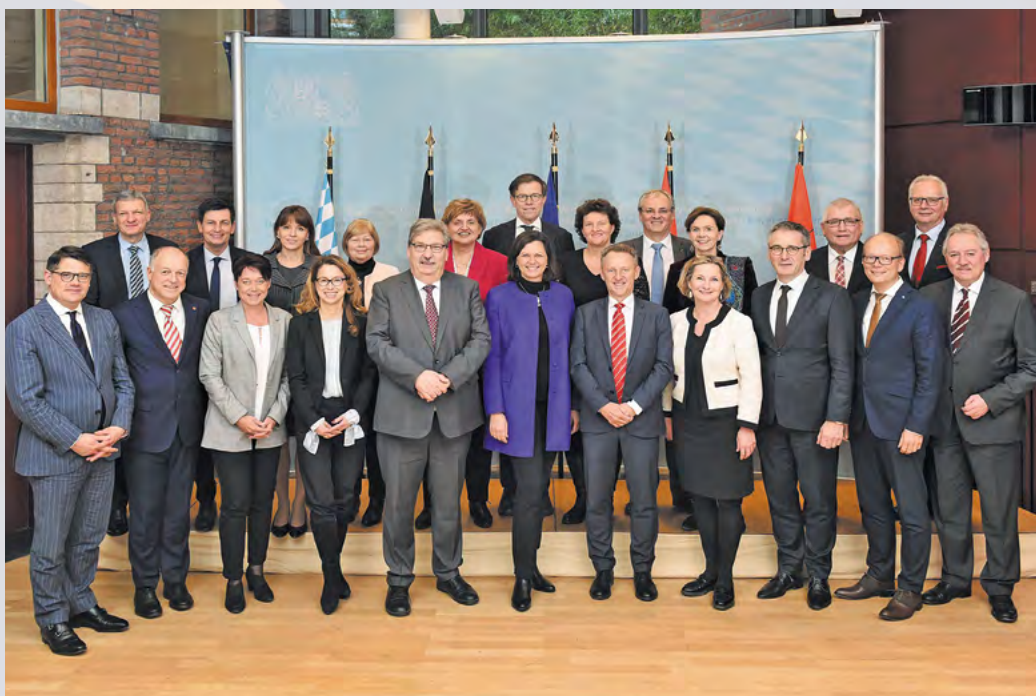
Der Präsident des Landtags NRW, André Kuper (vorn/2.v.r.), und die Präsidentinnen und Präsidenten der anderen Parlamente rufen die Bürgerinnen und Bürger zur Teilnahme an der Europawahl auf.

Zentrale Zukunftsfragen, wie die Wahrung europäischer Sicherheits- und Handelsinteressen, der Klimawandel, die Migration nach Europa, die Digitalisierung,