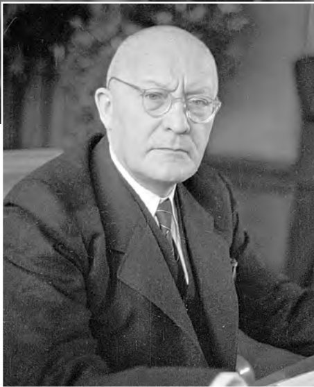
Der erste Ministerpräsident: Dr. Rudolf Amelunxen