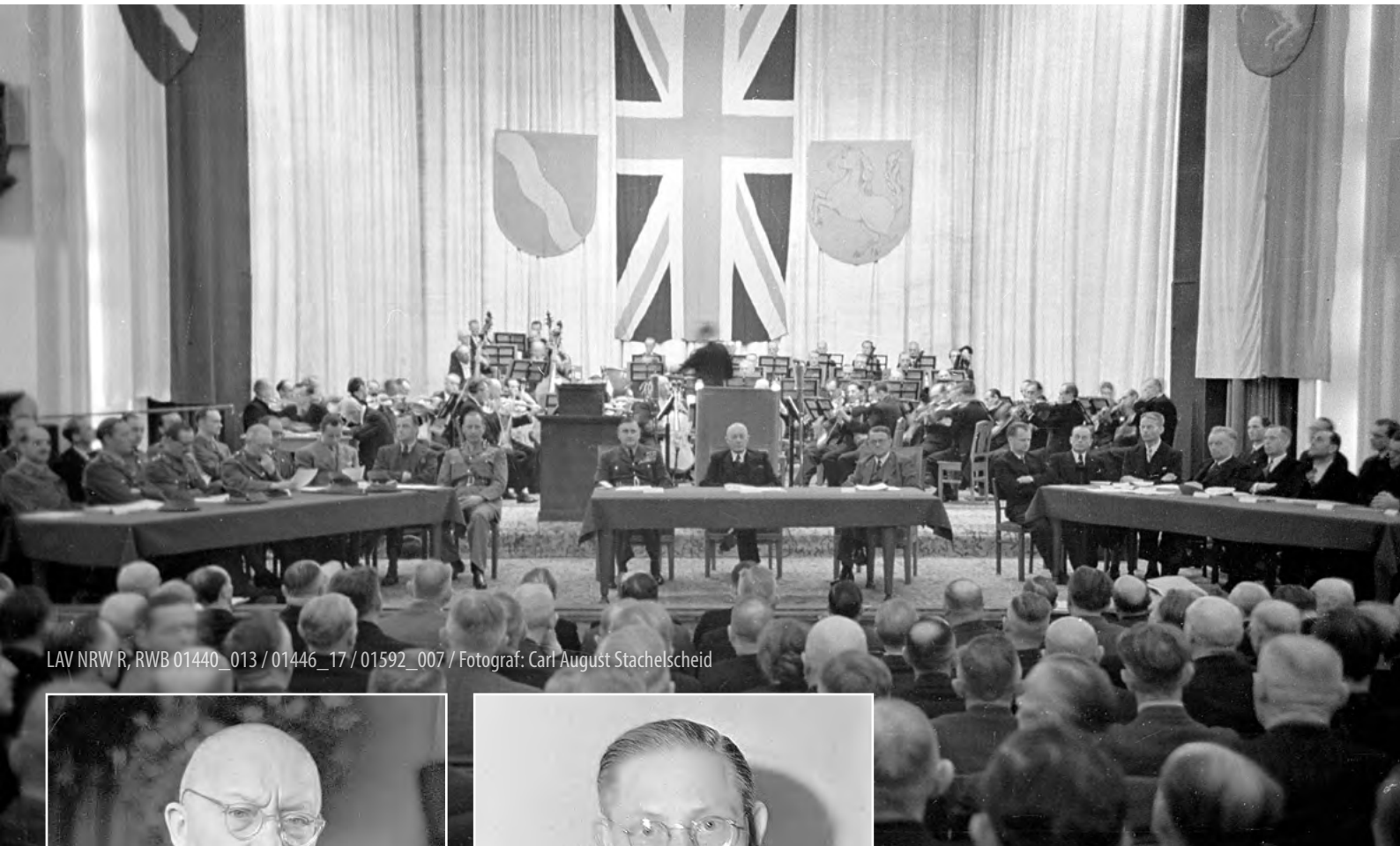
LAV NRW, RWB 01440_013 / 01446_17 / 01592_007 / Fotograf: Carl August Stachelscheid