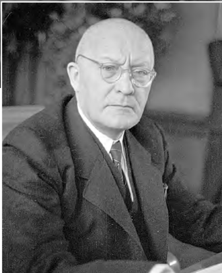
Der erste Ministerpräsident: Dr. Rudolf Amelunxen