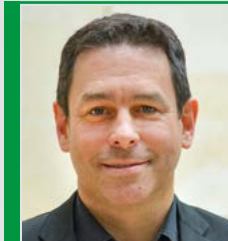
Arndt Klocke (Grüne)

... kann mit mehr Kassensitzen für Psychotherapeutinnen und Psychotherapeuten verbessert werden. Hierfür muss die sogenannte Bedarfsplanungs-Richtlinie der realen Nachfrage angepasst werden. Insbesondere das Ruhrgebiet und ländliche Regionen sind unterversorgt.